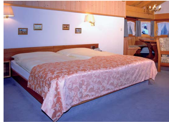
Zum Wohlfühlen: Bettwäsche ...

Viersternehotel im Zentrum von Zermatt. Der zurückversetzte Standort lässt den Gast die wohlthuende Stille der Bergwelt ungestört geniessen. Die ausserordentlich grossen Zimmer bieten jeden Komfort. Hundefreunde finden sogar ein Bett und einen Napf für ihren vierbeinigen Freund. Hotel Simi, Brantschenhaus 20, 3920 Zermatt Telefon 027 966 45 00, www.hotelsimi.ch