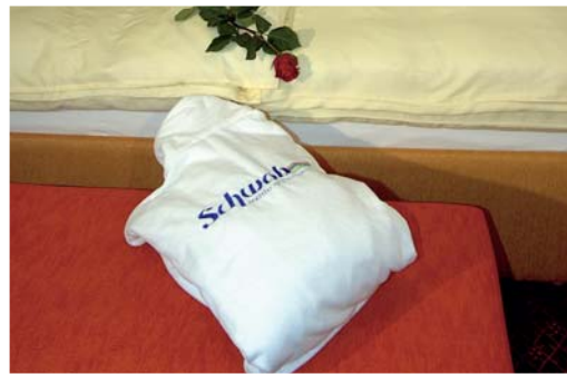
Bademantel in «Schwob-Qualität»

Fragen Sie auch nach dem Mietwäsche-Vollservice, bei dem Schwob das komplette Wäschemanagement Ihres Hotels übernimmt.