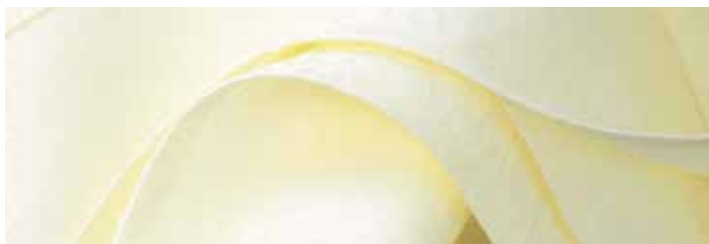
Nappage de Schwob aux coins cousus vidés