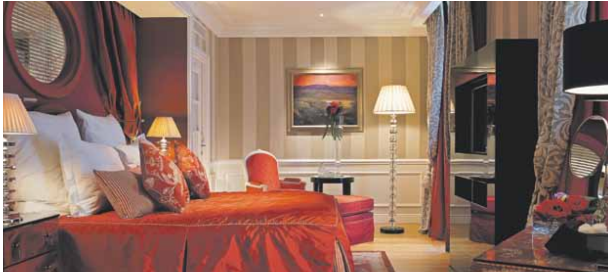
Les meilleurs tissus pour l'hôte exigeant: literie de la marque Schwob

Au Grand Hôtel du Lac à Vevey, le charme d'un établissement historique se marie avec le confort d'un établissement cinq étoiles moderne. L'expérience est de grande classe.