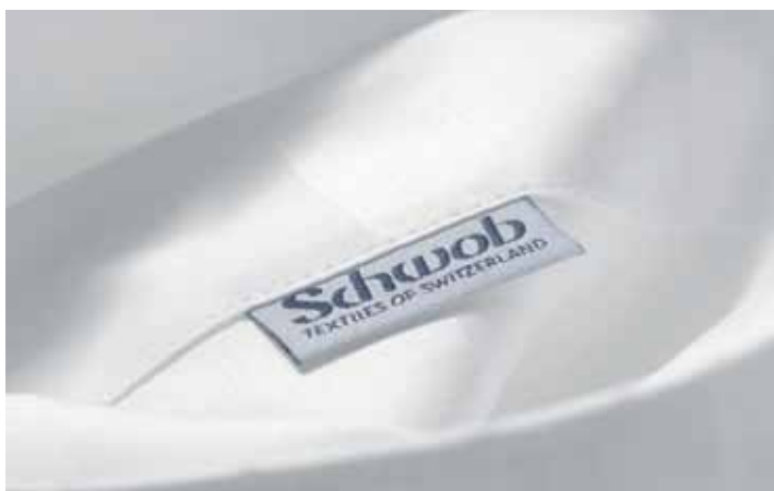
Literie de Schwob dans un doux ton champagne

La literie que le Grand Hôtel du Lac utilise dans ses chambres vient de l'entreprise de tissage de toiles Schwob dont les produits conviennent parfaitement au luxe de l'aménagement intérieur de ce cinq étoiles. Ainsi en vat-il aussi du format inusité des coussins 90x90 cm, recouverts des fourres haut de gamme de la marque Schwob. Le Grand Hôtel du Lac mise aussi pour le reste sur le linge distingué de Berthoud – que ce soit pour la table, pour le lit ou la salle de bains.